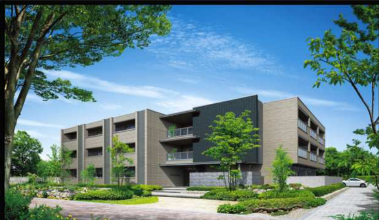
積水ハウスの賃貸住宅 シャーメゾン