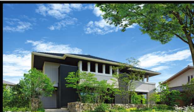
コンクリート外壁「軽量鉄骨造」 イズ