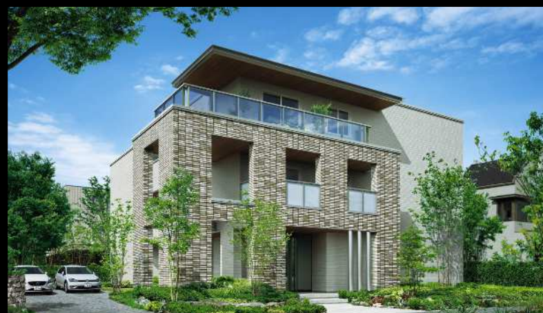
積水ハウスの医院併用住宅