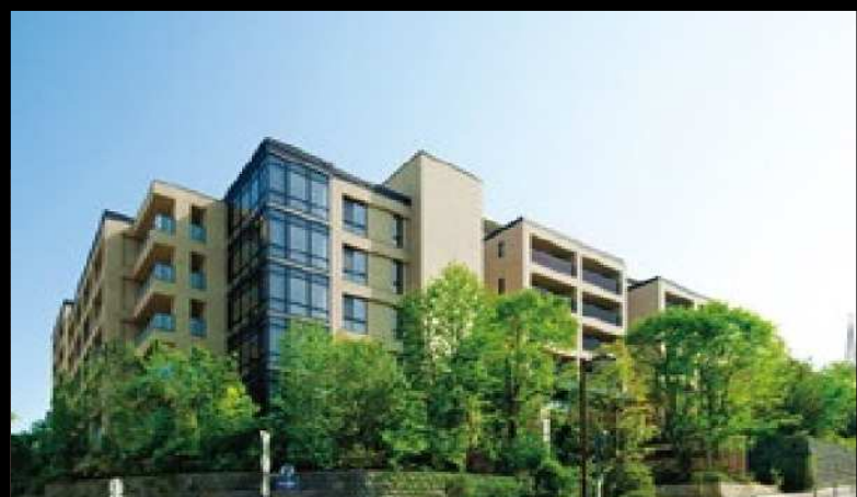
積水ハウスの分譲マンション グランドメゾン