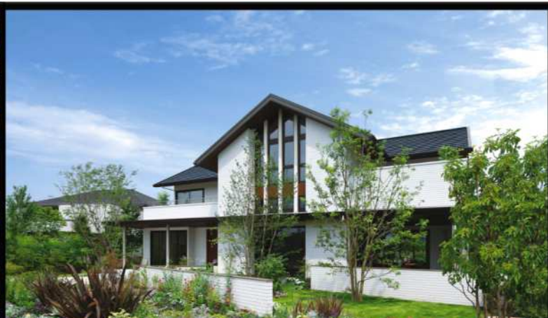
陶板外壁ベルバーン「木造」 シャーウッド