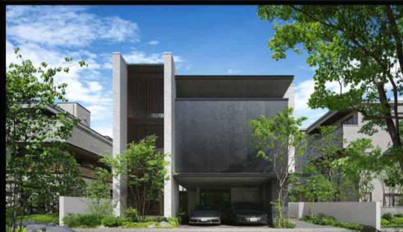
3階・4階建て「重量鉄骨造」 ビエナ